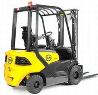
Der neue XD mit dem umfangreichen "OM Sicherheitsprogramm" OMISP.

Auch dieses Jahr ist der italienische Staplermarktführer OM Carelli Elevatori S.p.A., Lainate/Mailand durch seine Deutschlandzentrale, OM Pimespo, Weinsberg, auf der Stuttgarter LogiMAT vom 03. bis 05. März 2009 in Halle 7, Stand 265, präsent. Als Hersteller und Vollsortimenter mit über 90-jähriger Tradition ist OM für zuverlässige Staplerbaureihen bekannt.